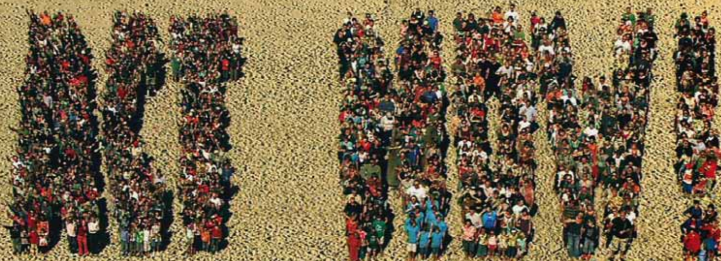
Wij vragen U een paar minuten de tijd te nemen voor een bezoek aan www.thebigask.eu en vervolgens te zien en horen wat de jongste generatie vindt van onze inspanningen.

Wij willen binnen de bedrijfs-economische kantlijnen, het maximale bereiken vanuit ons duurzaamheids jaarplan. Wij nemen graag het initiatief, en proberen binnen onze branche één van de voorbeelden te zijn.