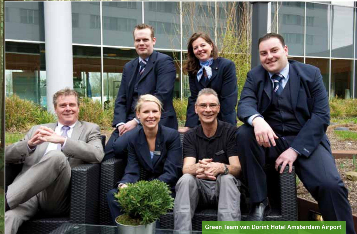
Green Team van Dorint Hotel Amsterdam Airport

Kijkend naar de groeiverwachtingen van Airbus, Boeing en IATA, zal het passagiers volume de komende 15 tot 20 jaar meer dan verdubbelen. Vooral door de groei in Azië, het Midden-Oosten en Afrika. Van +/- 17.000 vliegtuigen nu, naar bijna 40.000 over 15 tot 20 jaar. Dit houdt in dat alles wat onderdeel is van deze keten van activiteiten, min of meer gaat verdubbelen. Kunt u zich daar een voorstelling van maken?