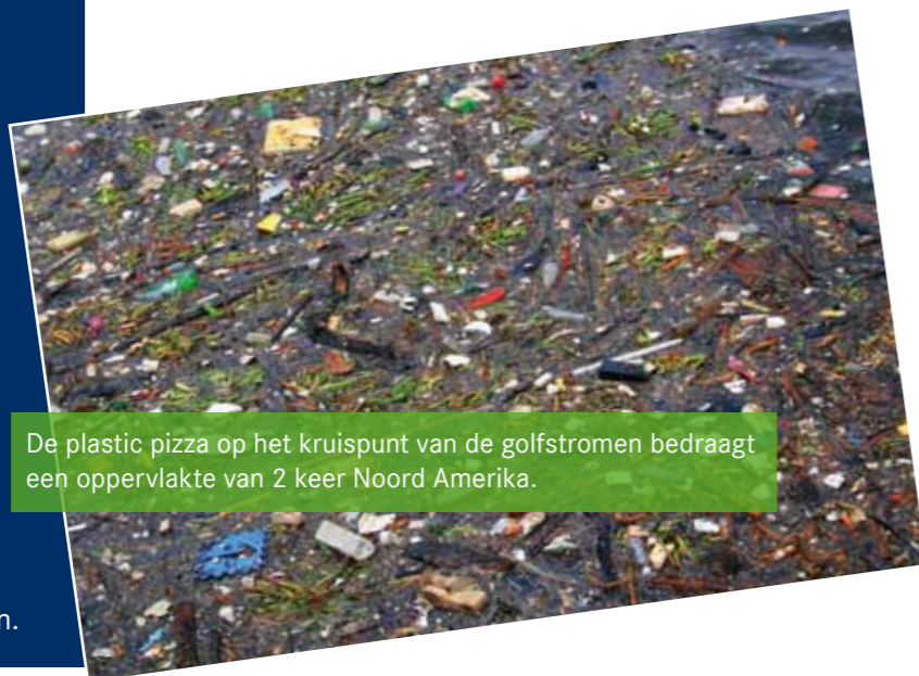
De plastic pizza op het kruispunt van de golfstromen bedraagt een oppervlakte van 2 keer Noord Amerika.

Het is onze stellige overtuiging dat we niet alleen hard moeten werken aan Greenkey of soortgelijke certificeringen. Duurzaamheid, Maatschappelijk Verantwoord Ondernemen (M.V.O) en Fairtrade hebben een veel bredere context dan alleen energie en CO2 uitstoot. Met ons M.V.O. plan schenken wij ook aandacht aan "De plastic Soup", stikstofmonoxide en stikstofdioxide en de maatschappelijke disbalans tussen veel culturen en economische markten die leiden tot een oneerlijke ongezonde samenleving.